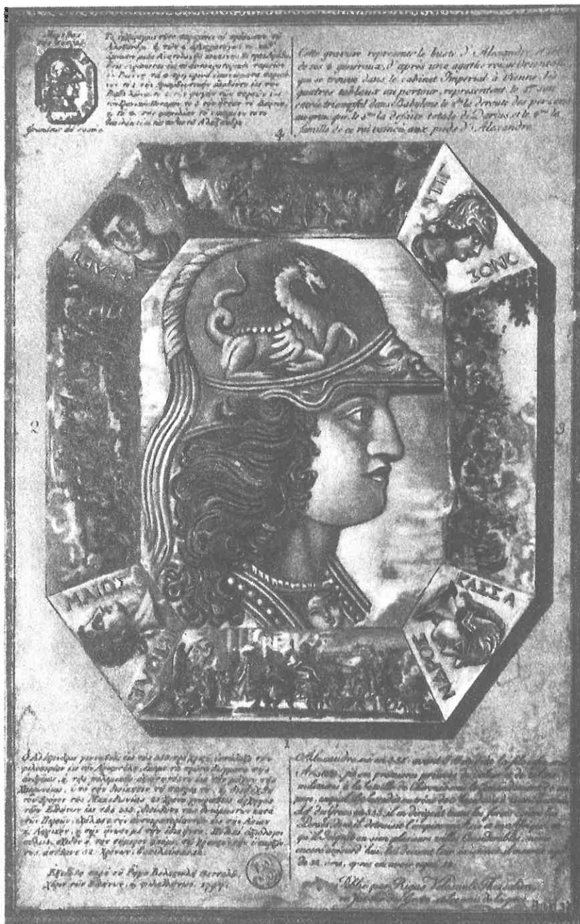
Εἰκὼν τοῦ Μεγάλου Ἀλεξάνδρου κατὰ τὴν ἔκδοσιν τοῦ Ρήγα (1797). (βλ. Γ. Λατοῦ, Οἱ Χάρτες τοῦ Ρήγα, σ. 67).