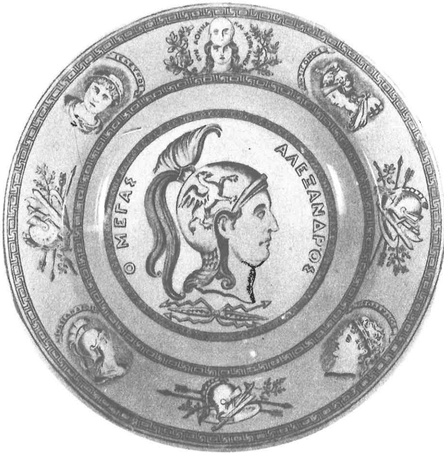
Εἰκὼν τοῦ Μεγάλου Ἀλεξάνδρου ἐπὶ πινακίου ἐκ πορσελλάνης (διαμ. 0,24 μ.).